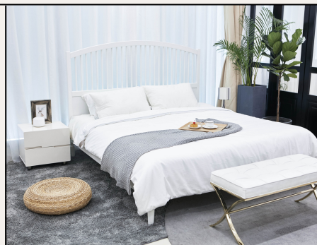
Table de chevet Console Bureau